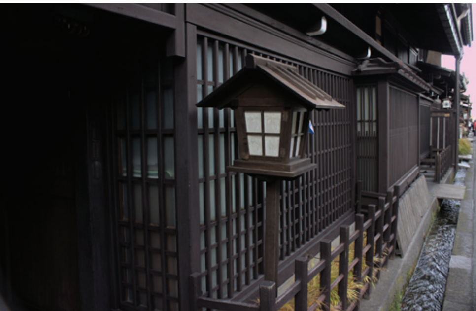
[PO LEWEJ] TYPOWY DOM MIEJSKI MACHIYA, TAKAYAMA.

doma oraz część mieszkaniową kyoshit-subu . Doma miała podłogę z ubitej gliny, zaś kyoshitsubu , składająca się z jednego lub więcej pomieszczeń, miała podwyższone drewniane podłogi, a w bogatszych domach również pomieszczenia z matami tatami . Podobnie jak w przypadku domu wiejskiego, głównym wejściem do mieszkania były zwykle wielkie drzwi ōdo , przez które wchodziło się bezpośrednio do doma . Dachy domów początkowo były kryte gontem i utrzymywane na miejscu przez kamienie ishioki itabuki ; z czasem zaczęto stosować dachówkę. Podobnie było w przypadku ścian: pierwotnie były cienkie, z odsłoniętym drewnem konstrukcyjnym, lecz z czasem zaczęto nakładać na nie gruby tynk zwany ōkabe-zukuri . Oba rozwiązania były częściowo próbą zapewnienia ochrony przed ogniem. Górne kondygnacje również rozwinęły się od początkowo ciemnych, niskich poddaszy do apartamentów o pełnej wysokości. Najwcześniejsza zachowana machiya to dom Kuriyama w Narze, który pochodzi z 1607 roku. Typowa działka domu miejskiego była wąska, ale głęboka, z magazynami kura i innymi pomocniczymi konstrukcjami na tyłach domu. Większość machiya to domy przylegające do ulicy stroną okapową hira-iri , w której znajdowały się drzwi wejściowe,